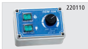
► Блок управления мотором страница 367