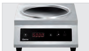
▶ Диаметр углубления конфорки: 280 мм