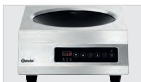
▶ Панель управления Touch-Control с цифровой индикацией