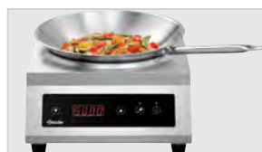
▶ Сенсорная панель управления с цифровым индикатором