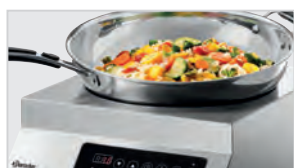
▶ Мощность конфорки: 3500 Вт