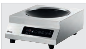
▶ Диаметр варочной поверхности: 260 мм ▶ Материал: SCHOTT CERAN®