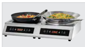
► Комбинация из Индукционная плита Индукционный вок

Стекло Стекло 3,5 кВт 3,5 кВт 240 мм 270 мм 17 35 °C до 240 °C 1 до 180 минут Необходимы 2 отдельные розетки 7 кВт | 230 В | 50 Гц 2 x 1 NAC Ш 680 x Г 435 x В 145 мм 11,87 кг