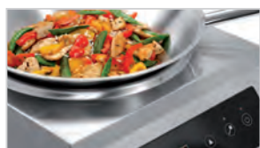
▶ Мощность конфорки: 5 кВт