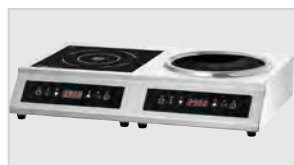
► Мощность конфорки 3,5 кВт ► Переключается отдельно