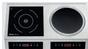
► Диаметр конфорки: 240 мм ► Диаметр углубления конфорки: 270 мм