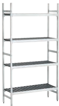
Комплект стеллажной сист. 1, B960