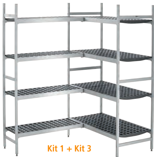
Kit 1 + Kit 3