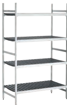
Комплект стеллажной сист. 2, B1080