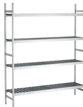
Комплект стеллажной сист. 3, B1500