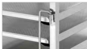
▶ По одному креплению емкости на передней и задней стороне